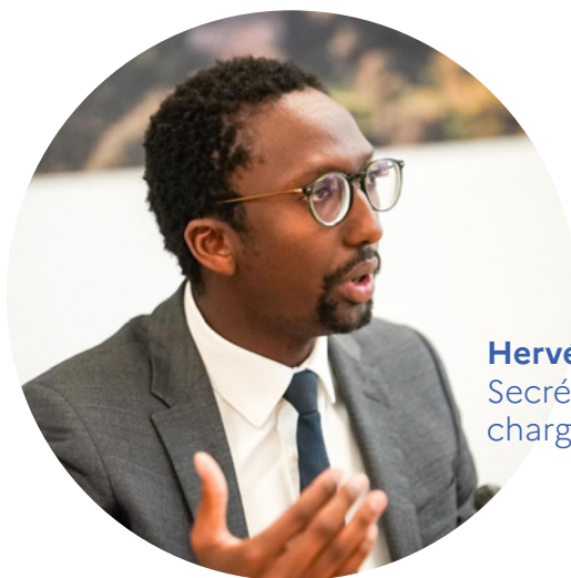
Hervé Berville Secrétaire d'État chargé de la Mer

L a mer est au cœur des enjeux de souveraineté, notamment alimentaire, et de maîtrise de nos approvisionnements. Elle est également au centre des enjeux de transition énergétique et d'adaptation aux effets du changement climatique, ainsi que de restauration de la qualité environnementale des milieux.